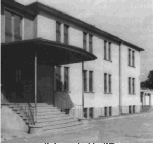
Neubau aus dem Jahre 1957

Zu Beginn des Schuljahres 1959/60 zog die Berufsschule in ihr neu errichtetes Schulgebäude in der Landrat-Neff-Str. in Michelstadt. Im Schuljahr 1962/63 wurde der Stadtschule dann ein Realschulzweig integriert. 1963 wurde die Schule zur Mittelpunktschule erklärt und bekam noch im selben Jahr den Namen „Theodor-Litt-Schule“. Mit Einführung der 9.Hauptschuljahre wurden 1965 zwei Pavillons auf dem rückseitigen Schulgelände errichtet und bezogen.