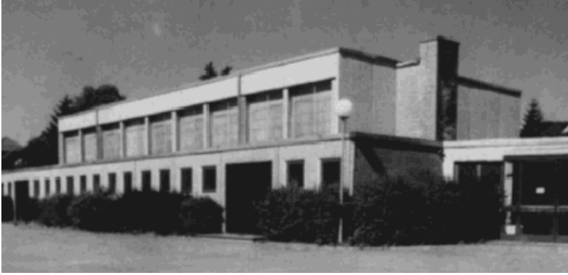
Turnhalle: Neubau von 1968

Nachdem zum 1. Januar 1970 die Trägerschaft für Grund-, Haupt-, Sonder-, und Realschulen durch gesetzliche Regelung von der Stadt Michelstadt auf den Odenwaldkreis übergegangen war, wurden nach den Sommerferien 1970 die Grundschulen in Rehbach, Ober-Mossau, Steinbuch, Weiten-Gesäß und Stockheim aufgelöst und die Kinder nach Michelstadt überwiesen. Die Schülerzahl stieg von 967 auf 1167 an. Die frei gewordenen Lehrer gingen ebenfalls nach Michelstadt.