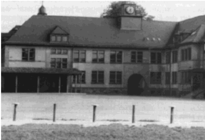
Baubeschnitt aus dem Jahre 1928/29 Links die Pausenhalle von 1956

bezugsfertig und wurden am 19.01.1929 feierlich eingeweiht.