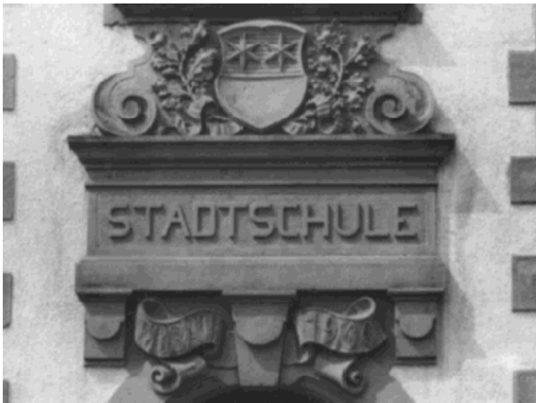
Türschwelle über dem alten Eingang der Stadtschule an der Schulstraße

Der ehemalige Schulleiter und Rektor der Stadtschule, Ludwig Walther schreibt in seinem Buch: „Aus der Geschichte der Michelstädter Schulen“,...“ dass am Rande des damaligen Städtchens, in den „Beinegärten“ im Jahre 1900 ein neues Schulgebäude mit 4 Klassenräumen errichtet wurde. Das neue Schulhaus wurde offiziell am 20.10.1901 seiner Bestimmung übergeben.